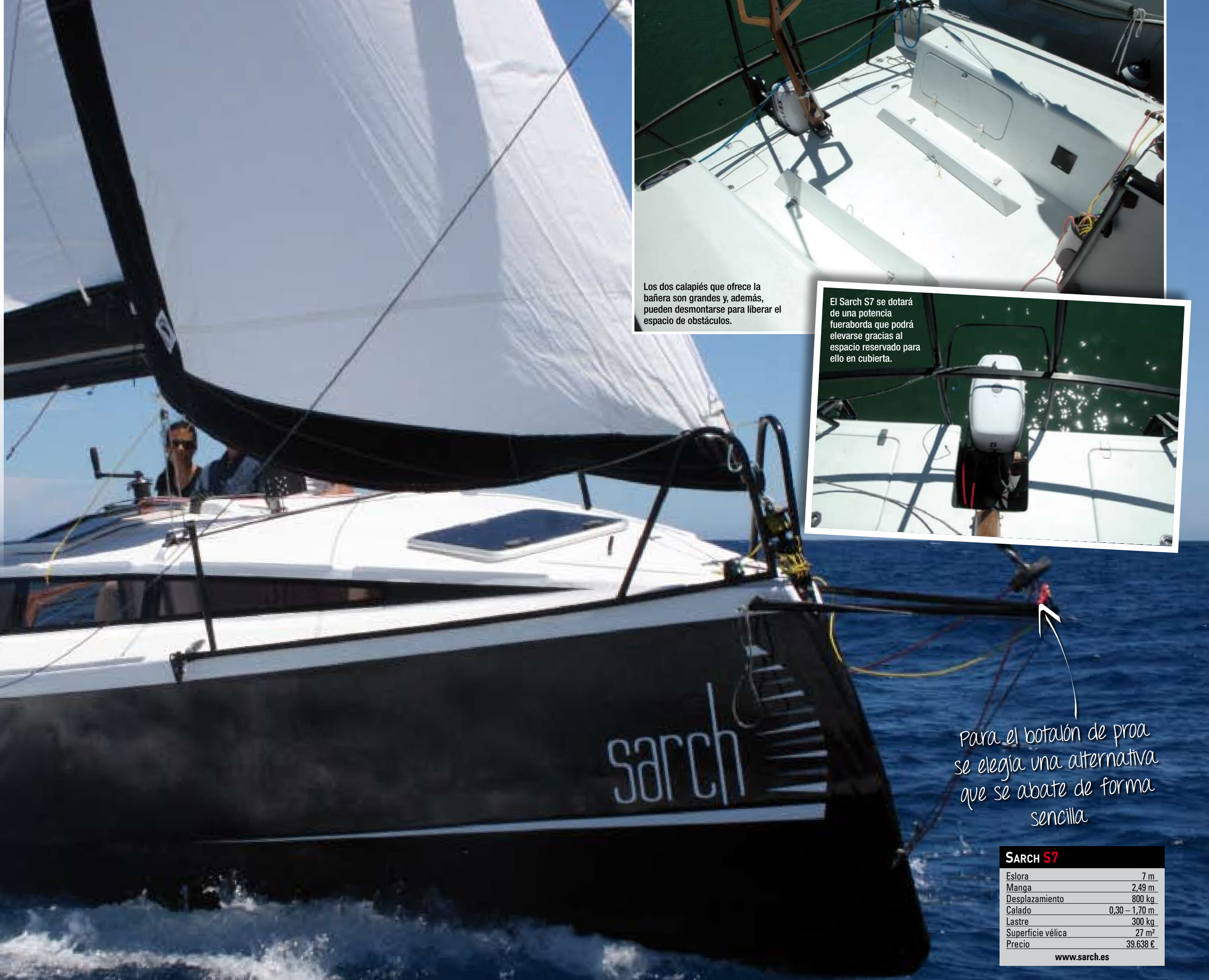
Los dos calapiés que ofrece la bañera son grandes y, además, pueden desmontarse para liberar el espacio de obstáculos.

A la hora de navegar, la quilla, en aluminio y con bulbo de plomo, baja el centro de gravedad al máximo para poder izar una potente superficie vélica y ofrece una relación con el desplazamiento del 38%. En el otro extremo, las velas encuentran apoyo en un mástil alar giratorio abatible mediante un sencillo sistema y una botavara de carbono y se componen de serie por una mayor top squared full batten con tres rizos de 17,5 m 2 y un foque autovirante de 9,5. Prestaciones y simplicidad de maniobra unen fuerzas en este punto, en el que también tiene ➔